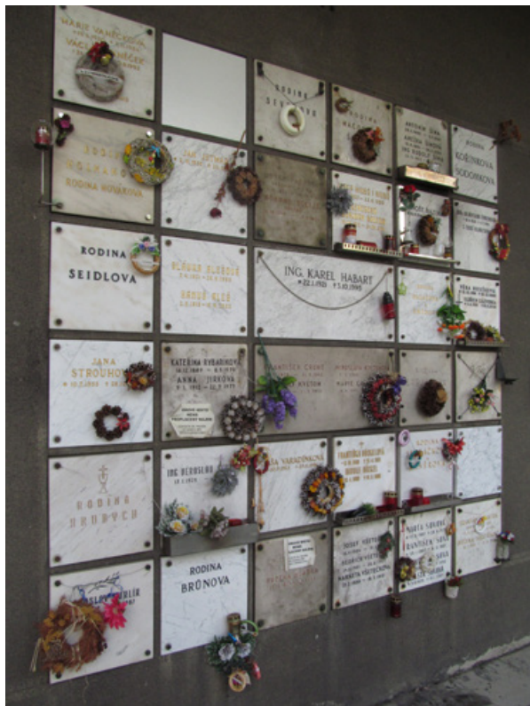
2. Věřící Církve československé (husitské) běžně užívali občanská kolumbária a urnové hroby, jenom v některých případech přitom lze identifikovat jejich konfesionalitu – zde předposlední deska v prvním sloupci kolumbária u krematoria v Praze-Strašnicích. Foto Z. R. Nešpor, 2015.