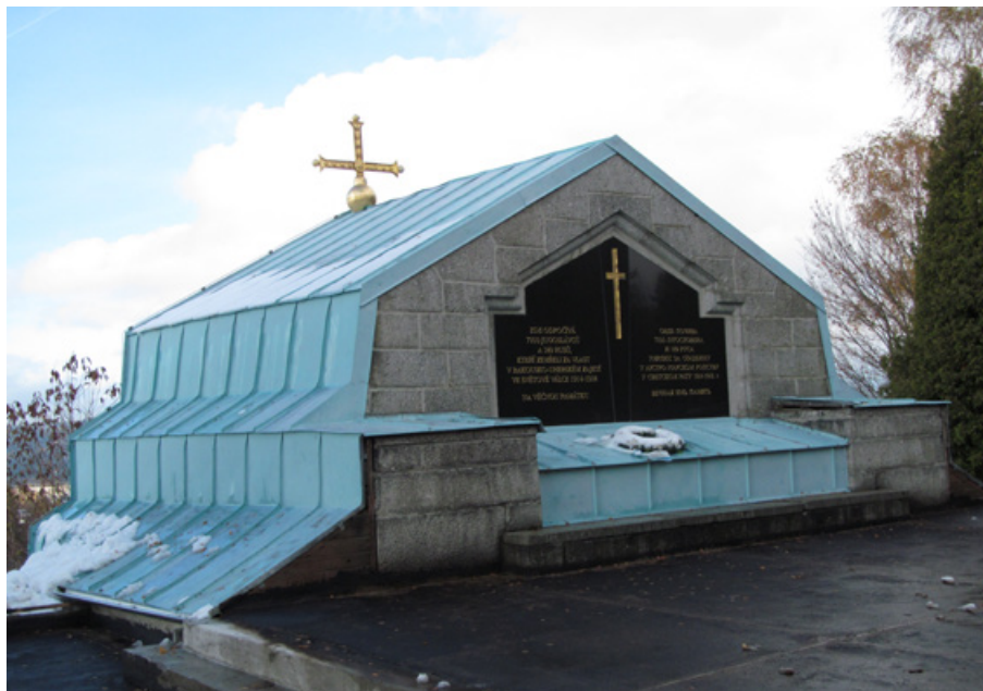
8. Mauzoleum s pravoslavnou kaplí na památku srbských zajatců a vojáků zemřelých během první světové války v Jindřichovicích (1928–32); objekt zároveň slouží jako vodárna. Foto Z. R. Nešpor, 2015.

Již v roce 1905 se totiž představiteli českých pravoslavných Nikolaji Ryžkovovi podařilo vyjednat propůjčení části pražského obecního hřbitova (část nového Olšanského hřbitova), aby pravoslavní věřící měli své vlastní konfesní pohřebiště (ibid.: 230–231). Meziválečná existence poměrně rozsáhlé komunity exulantů z Ruska vedla k rozšíření tohoto prostoru, ani to však nestačilo a mnozí pravoslavní proto nezávisle na teologickém zákazu volili pohřeb žehem, snad také v naději na pozdější přemístění ostatků do vlasti (Nešpor – Nešporová 2011: 573). Řada pravoslavných vedle toho využívala služeb dalších obecních nebo církevních hřbitovů, což se stalo běžnou praxí i po druhé světové válce. I když v tomto období vzniklo asi 83 pravoslavných církevních obcí (vedle 16 obcí existujících v meziválečném období a po druhé světové válce obnovených), 26 některé z nich s využitím majetku zrušené Německé evangelické