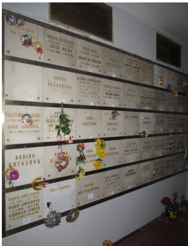
4. Původní kolumbárium Církve československé (husitské) na ochozu Husova sboru v Praze-Vinohradech projektoval Pavel Janák společně s kostelem, postaveným v letech 1930–35.

československé mezi uživateli krematorií: v roce 1930 šlo o 14 procent všech pohřbů žehem, v roce 1940 o 20 procent a v roce 1949 téměř o čtvrtinu (Nešpor – Nešporová 1911: 588). 14