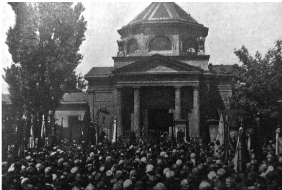
1. Účastníci pohřbu Karla Farského před provizorním pražským krematoriem. Přetisk z Českého zápasu 1927.

místa – a s nimi spojených měnicích se a sociálně a personálně podmíněných kulturních významů.