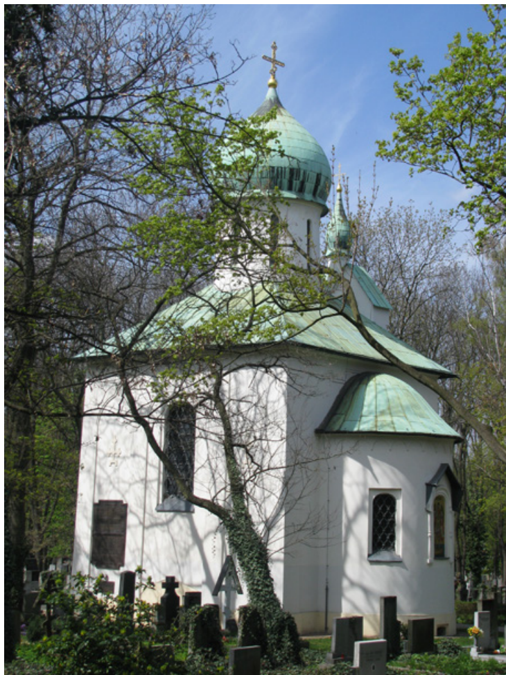
7. Pravoslavná kaple Zesnutí přesvaté Bohorodice (1924–25) na „pravoslavném oddělení“ pražských Olšanských hřbitovů. Foto Z. R. Nešpor, 2015.

ve prospěch kremací a kolumbárií zase zdůrazňoval jejich pietní charakter a rovnost mezi zesnulými (Kordule 1937: 87). Vzhledem k nedostatečné pramenné evidenci nemůžeme konstatovat, zda se skutečně podařilo vybudovat nebo zřídit kolumbária ve všech chrámových sborech, případně v jakém časovém horizontu, přinejmenším ve většině z nich k tomu však nepochybně došlo. Podle poslední